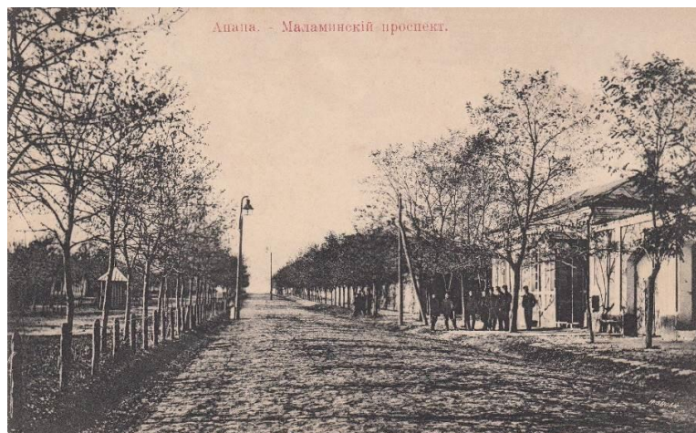
Рис. 3. Анапа. Маламинский проспект. Фотография 1900–1910 гг. [17]

отпочкования от материнского курорта дочерних курортов. С Анапой был генетически связан курорт-сад. Последний был создан в 1900-х гг. в 25 км от нее, в Семигорье, на границе леса и степи, после проведенного в 1901 г. обследования, подтвердившего целебные свойства имевшихся там источников [3; 6, с. 16–17, 21; 16, л. 9–10] (рис. 6).