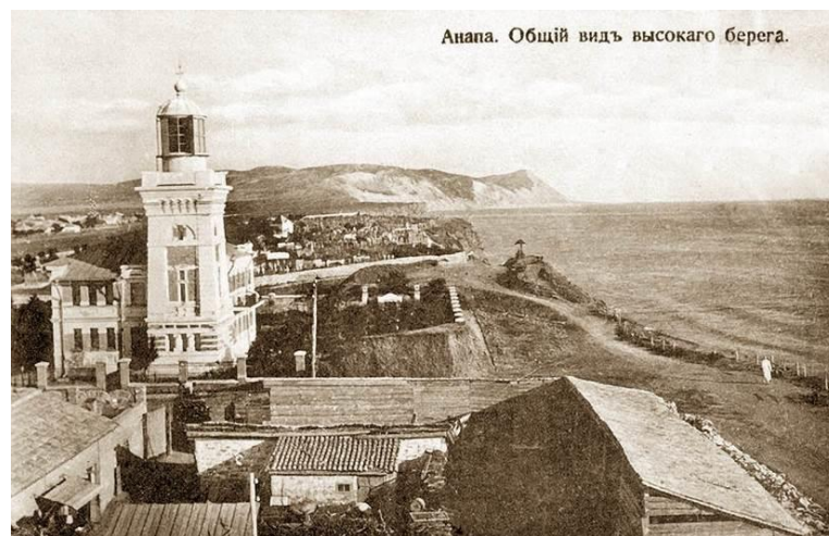
Рис. 5. Анапа. Общий вид с высокого берега на маяк. Фотография 1900–1910 гг. [17]

как осмысленные ориентиры [4, с. 261]. При этом история их возникновения, разрушения и последующего восстановления отражает весь ход истории самого города. «В градостроительном отношении храмовым комплексам отводилась доминантная роль в формировании существующей застройки [10, с. 45]. Так «с середины XIX в. церкви и часовни были неизменным элементом застройки в укреплениях Черноморской береговой линии [13, с. 18].