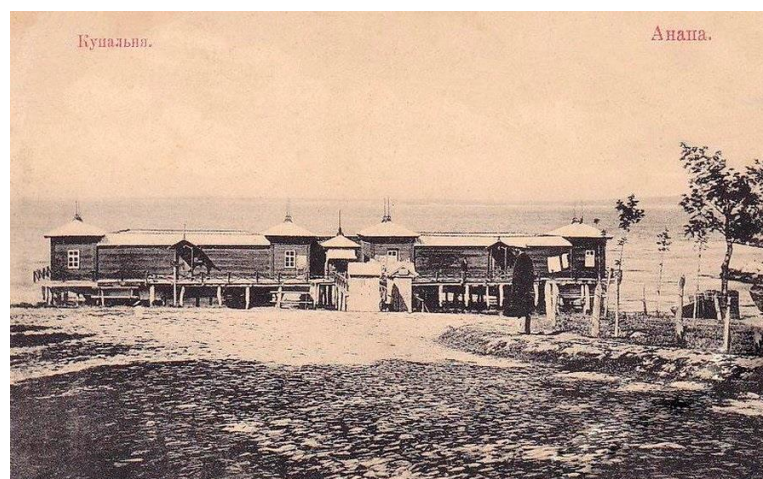
Рис. 4. Анапа. Купальни. Фотография 1900–1910 гг. [17]