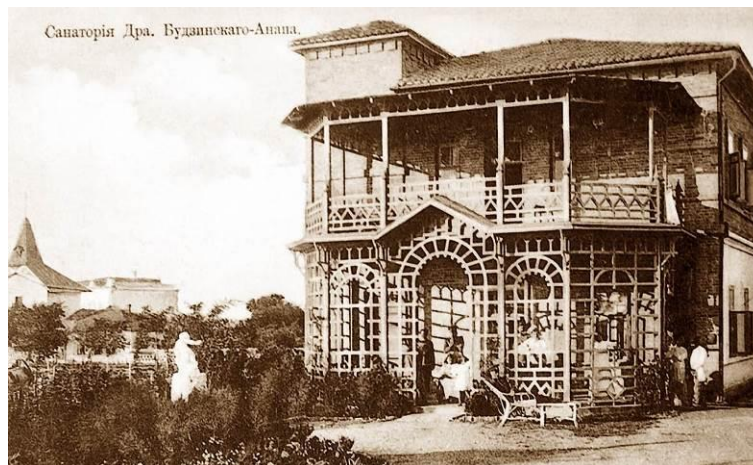
Рис. 7. Анапа. Санаторий доктора В.А. Будзинского. Фотография 1900–1910 гг. [17]

ментов города как с территориальным пространством, так и с экономико-социальным и географическим положением. Сугубо городским порождением стал в дореволюционное время феномен дачи – дома, который приобрели популярность среди состоятельных людей, проживавших в Анапе [2; 5].