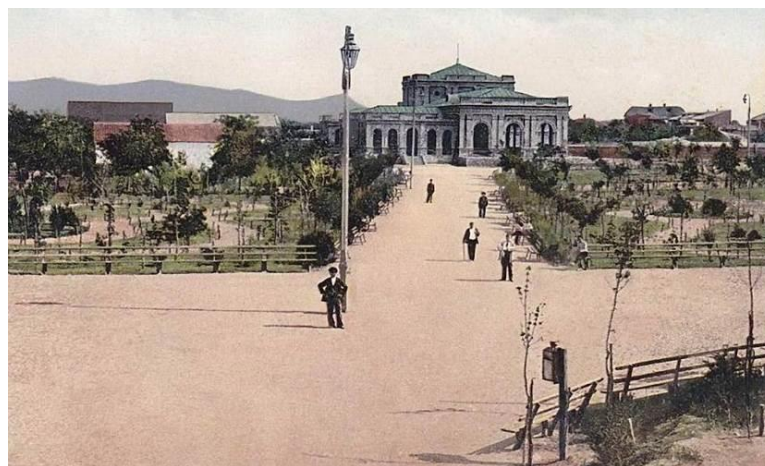
Рис. 6. Анапа. Курзал. Фотография первой половины XX в. [17]

Становление, трансформация и последующие изменения в градостроительной ситуации Анапы были обусловлены множественными факторами, традициями и культурой, национальными и государственными интересами, а также формированием природных ландшафтных и искусственных комплексов. На преемственность развития города оказывала влияние функционально-генетическая типология поселений Кубани. При этом ретроспективный анализ данного генезиса помогает лучше восстановить историю архитектурно-градостроительного развития города, определить ключевые моменты регулярной планировочной структуры поселения, выявить основные исторические периоды его преобразования. Отмечается рост численности населения, усиление взаимосвязей структурных эле-