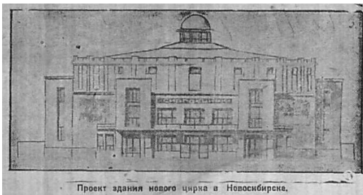
Ил. 5. Проект цирка [Советская Сибирь. 1930].

Вопрос о необходимости строительства в городе большого каменного циркового здания встал на заседании Новосибирского городского совета ещё в июле 1930 года. «Опрос, проведённый на предприятиях, показал, что большинство рабочих Новосибирска считает наиболее целесообразным строить цирк за домом быв. Промбанка, на центральном базаре (ныне двор за мерией Новосибирска — К.Г.). Так проектировало и управление зрелищными предприятиями» (ил. 5).