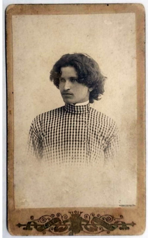
Ил. 1. Иван Иванович Загривко-Загреев. [Электронный ресурс. Новосибирск в фотозагадках URL: https://nsk-kraeved.ru ].

Борец ещё станет профессором, генерал-лейтенантом инженерных войск и активно проживёт 101 год. В Новосибирске он будет один из авторов нескольких известных зданий: Дома Ленина, кинотеатра «Пролеткино» (ныне «Победа»), а в 1925-м разработает первую перспективную планировку Новосибирска — город-сад, такой же фантастически-романтический, как и его голубая маска (ил. 2).