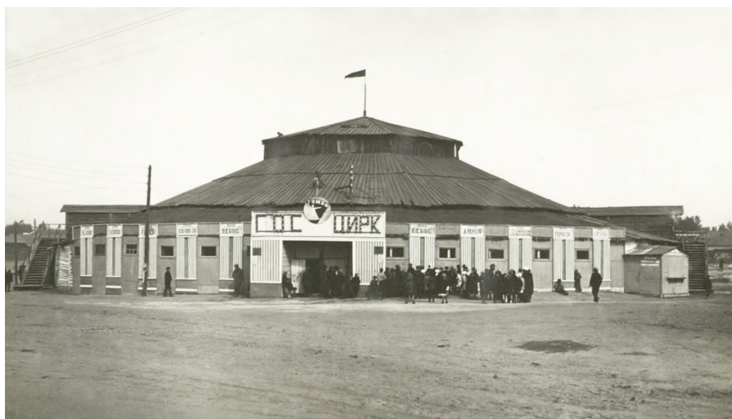
Ил. 3. 1-й Сибирский Госцирк [Музей Новосибирска]. Fig. 3. 1st Siberian State Circus [Novosibirsk Museum].