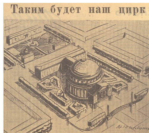
Ил. 6. Проект цирка [Вечерний Новосибирск. 1958].

Это должно было быть здание с самым большим в городе зрительным залом. Первый в стране цирк такого рода. «Сложное по объёмно-планировочному и конструктивному решению здание» было спроектировано в Московском институте «Гипротейтр» архитекторами С.М. Гельфер, Г.В. Напреенко и конструктором В. Корниловым. Проект предусматривал возможность многофункционального использования: «как цирка, киноконцертного зала, зала массовых собраний, спортивных демонстраций, устройства выставок» [Баландин, 1986, с. 91]. Это было здание совершенно нового типа. Так, в начале 1930-х, по этому же принципу задумывался ДНИК (Дом науки и культуры), в результате ставший знаменитым оперным театром.