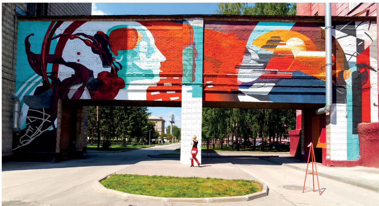
Ил. 6. С. Соловьева, Д. Серякова. «Биопротезирование», роспись на фасадах НГТУ, 2019 г.

Пути поиска изобразительного языка произведений монументального искусства в Новосибирске на научную тему в советский период и современный разнообразны и неоднородны. В любом случае они отражают актуальные на момент реализации произведения символы и знаки эпохи, несут в себе тот информационный срез, который является необходимым, востребованным и