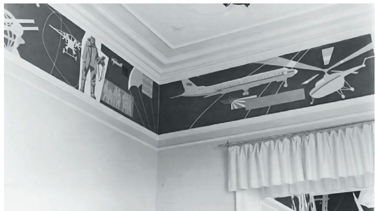
Ил. 1. Роспись в кафе «Спутник», 1960 г.

В 1960-е гг. сюжетные линии, связанные с космосом, были представлены в несколь- ких произведениях. В 1963 г. в построенном Дворце пионеров на проспекте Кирова В.Г. Кирьянов, И.П. Наседкин и В.В. Семенов создали роспись, в которой фигуры созвездий были поданы очень зрелищно. «Большая Медведица напоминала массивную скульптурную форму медведя, по абрису которой белой линией прочерчена узнава- емая схема созвездия; Гончие Псы темными силуэтами несутся за ракетой, оказавшейся в межзвездном пространстве на охраняемой