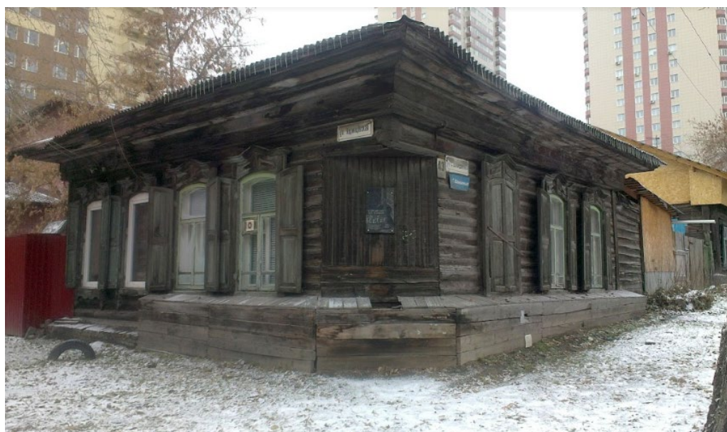
Ил. 3. Вид дома с перекрестка, 2018 г.

ЦАМО — Центральный архив Министерства обороны Российской Федерации