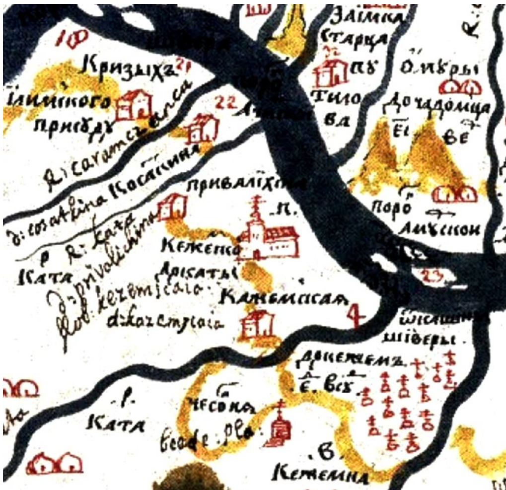
Ил. 1. Река Верхняя Тунгуска (Ангара) на «Чертеже земли Енисейского города» С.У. Ремезова. Фрагмент. 1697 г. [Чертежная книга Сибири..., л. 16]

На рубеже XVII–XVIII вв. С.У. Ремезов в «Чертежной книге Сибири» на «Чертеже земли Енисейского города» (составленном в 1697 г.) [Чертежная книга Сибири..., 1882, л. 16] впервые изобразил местность и некоторые объекты у Кашины шиверы на Верхней Тунгуске (Ангаре) (ил. 1). На правом берегу Тунгуски, между ее притоками — реками Кода и Ката (вероятно, первоначальное название р. Кежма), имеется надпись «от Кашины шиверы до Кежем Е (5 — Авт.) дней в судне». Рядом с надписью — условные изображения надмогильных крестов, а невдалеке от них показаны деревянное строение