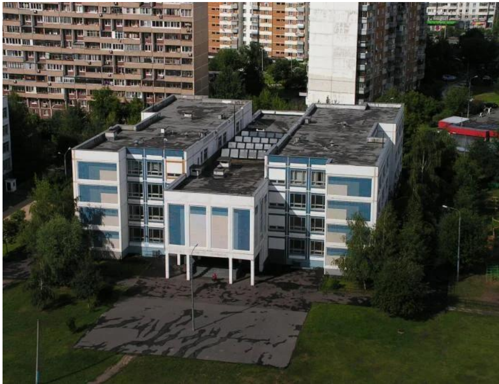
Школа серии V-92