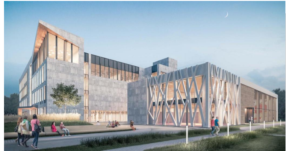
Хорошевская гимназия, Москва, 2017г.