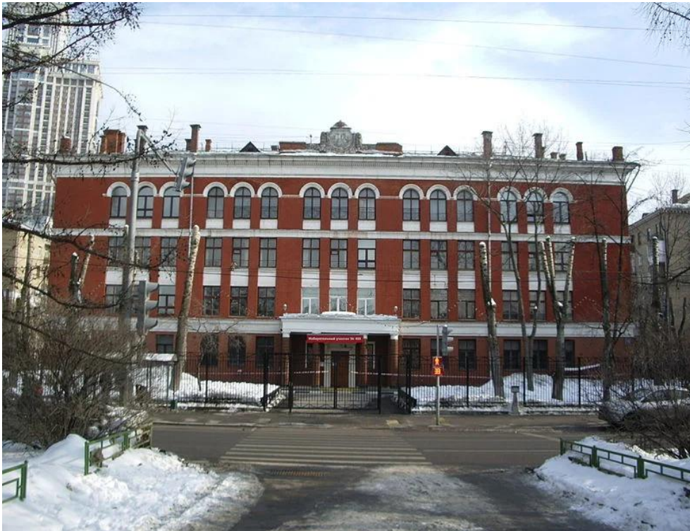
Школа Степановой по проекту 1949 года